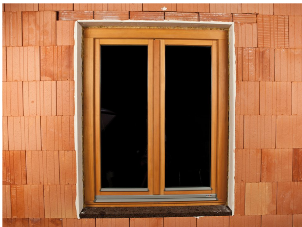
Fenster ist bereits montiert, CONTEGA FIDEN EXO wird anschließend eingebaut.