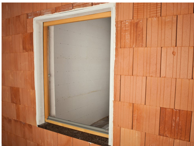
Fertiger winddichter und regensicherer Anschluss.