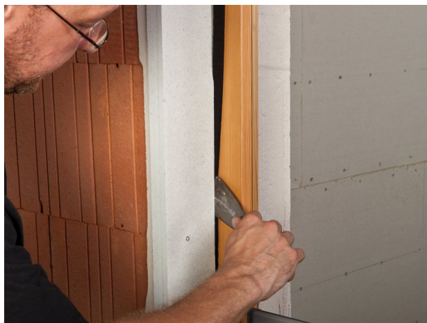
... und den überkomprimierten Anfang des Bandes (ca. 2 cm) abschneiden. Band vorsichtig mit einem Spachtel kantenparallel in die Fuge einbringen. Um ein Herausquellen zu vermeiden, CONTEGA FIDEN EXO immer mit einem Rücksprung von 1 - 2 mm einbauen.